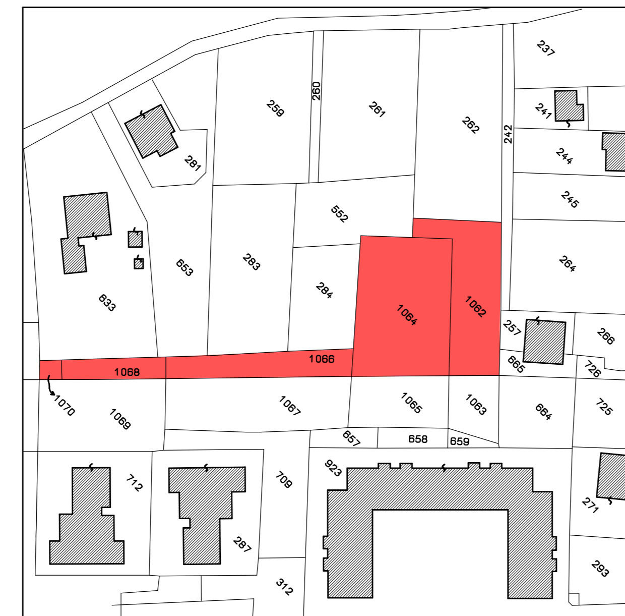
STRALCIO MAPPA CATASTALE - Scala 1/1000

FOGLIO 94 MAPPALI 1062-1064-1066-1068-1070